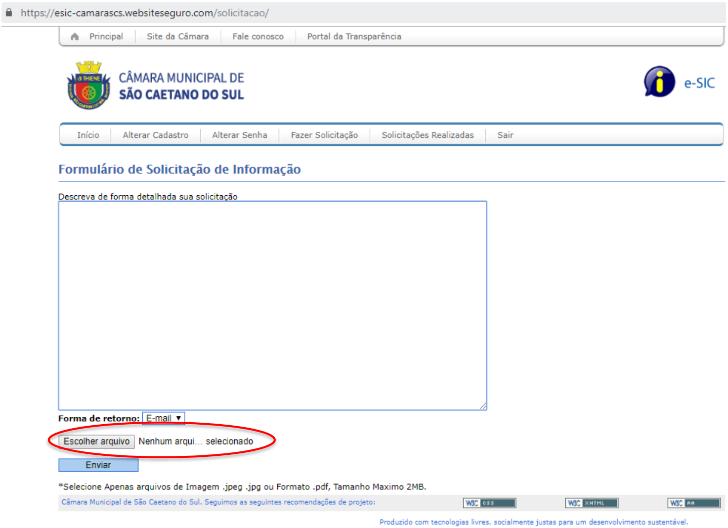
Figura 2 - e-SIC Câmara Municipal de SCS - exemplo do campo para inserção de anexos